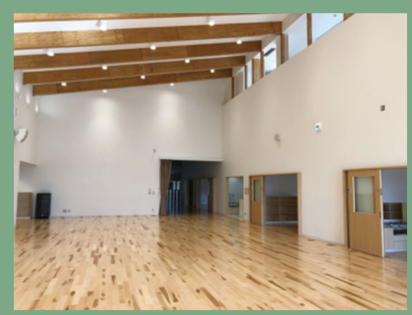
伐採した木材は、主に村内の公共施設の建材として活用。写真は、カラマツ材を使った村の保育園。木の温もりが感じられます。