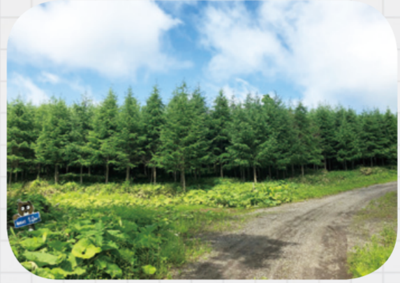
幅広い林齢の人工林資源を見ることができます。