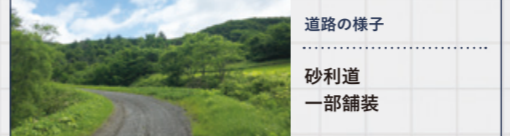
道路の様子 砂利道 一部舗装

沿線の展望台から見渡せる牧草地では、のんびりと草を食む牛の姿を見られることも。天気がよければ、阿寒連峰の堂々とした威容を望むことができます。大きく深呼吸したくなる場所です。林道は草地と人工林の間を縫うように通っています。緑の濃さや景色の対比にも注目してください。