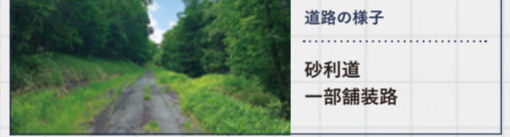
道路の様子 砂利道 一部舗装路

豊かな天然林に抱かれたルート沿いには、谷間に向かって思い切り「ヤッホー」と叫ぶとても気持ちよくなるポイントがあります。林業関係者が全国から視察に訪れるような、美しく整備された人工林も。環境への負担に配慮した低コスト林業を実施しており、注目されています。