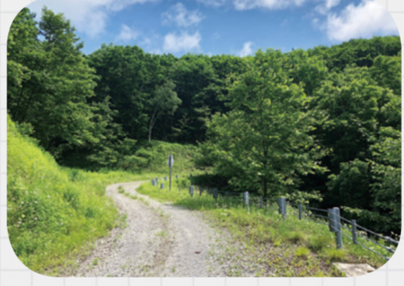
比較的新しい林道で、砂利道でも走行しやすいです。