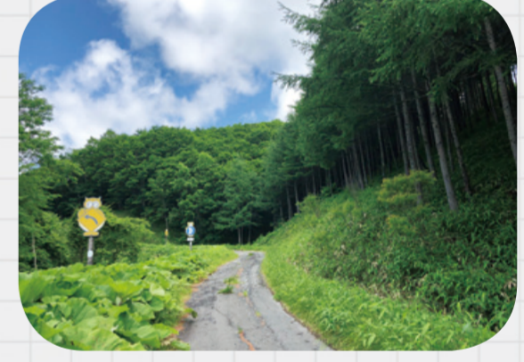
整然と列状に干ばつされたカラマツ林。