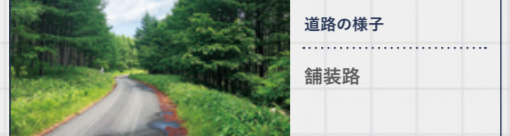
道路の様子 舗装路

全区間舗装路として整備された林道。山間部地区を結ぶ連絡機能路線として、また大規模森林整備帯を通る基幹林道として、林業における重要な役割を果たしています。きれいに立ち並ぶカラマツ林帯や、雄大な風景を眺望できる場所もあり、見どころがぎゅっと詰まっています。