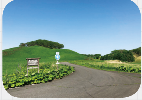
森林整備や木材生産を進めるうえで重要な幹線となります。