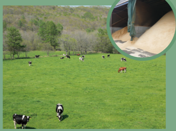
間伐材は砕いておが粉に加工。家畜舎の床に敷く材料などとして活用しています。畜舎の衛生環境の向上は、乳質の改善にもつながります。

林道で見られる木 人工林 カラマツ、トドマツ、エゾマツ、シラカバ(村の木) 天然林 ナラ、ニレ、ハンノキ、メジロカバ など