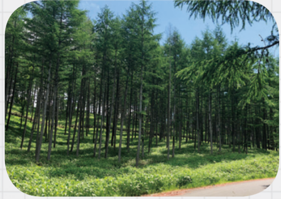
きれいに整備されたカラマツ林帯。