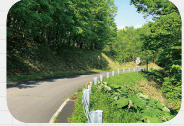
令和2年度、林道の適正維持管理が行われており、優秀賞(林道維持管理部/一般社団法人北海道治山林道協会)を受賞。