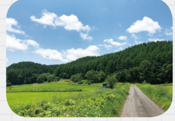
アシベツ川に沿って整備されました。