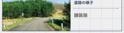
道路の様子 舗装路

全区間舗装路。サイクリングにはもちろん、ドライブにも快適なルートです。釧路湿原の秘境スポットとして有名なキラコタン岬や宮島岬への入り口も、この林道沿いに設けられています。牛の放牧風景や阿寒連峰を望む絶景ポイントもあり、鶴居村に流れるゆったりと穏やかな時間を感じることができます。