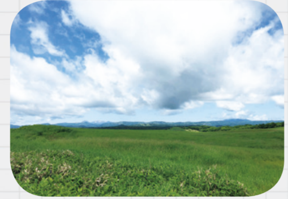
支雪裡地区側にあるビュースポット。広がる空と緑の草地のコントラストは、清々しいほどです。