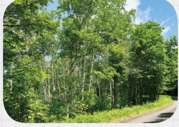
村木でもあるすなりと優美な白樺がたくさん並ぶ光景が。