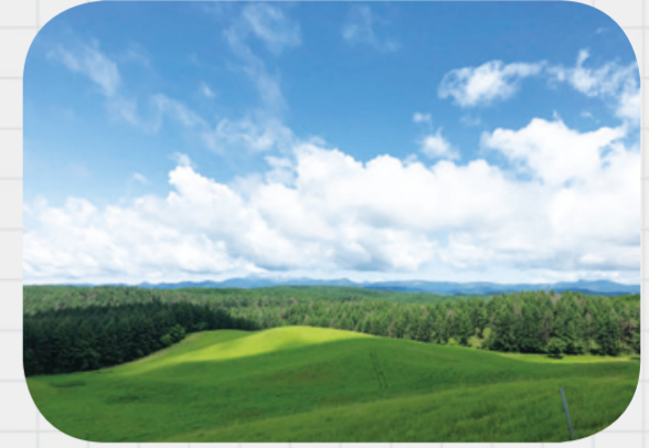
展望台から望む風景。ぼーっと眺めているだけで、心が解き放たれていきます。