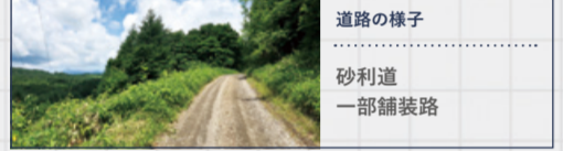
道路の様子 砂利道 一部舗装路

カラマツからなる、豊富な人工林資源を備えた林道。沿線には、鶴居村村民の森・保健保安林を有し、キャンプ場やフットパスコースなどの森林散策路も整備されています。キャンプ場を利用して、早朝から周辺散策というのも楽しそうですね。ここにしかない学びと感動を体感してください。