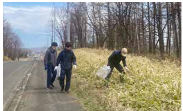
道道沿いでのごみ拾いの様子