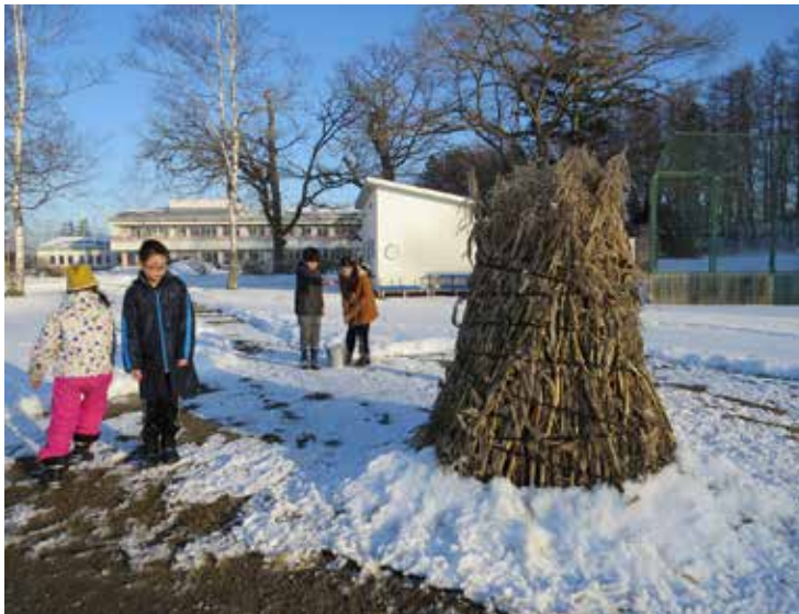
幌呂小学校で給餌の様子（2018年12月17日）

江戸時代までは北海道各地で繁殖し冬は本州まで渡りをしていたタンチョウは、明治時代に入り乱獲と主な繁殖地だった道央圏の湿原の開発の影響で人前から姿を消しました。一時は絶滅したと思われていたタンチョウですが、今からちょうど100年前の1924年に鶴居村（当時は阿寒郡下辛村）チルワツナイで十数羽が確認されました。今年は「タンチョウ再発見から100年」という節目の年です。