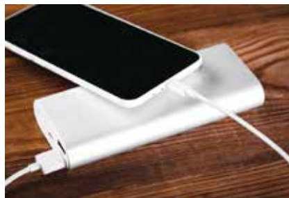
※充電電池からの出火