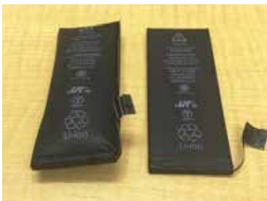
※膨張した電池(左側)