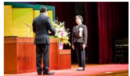
大石村長から受表彰者へ表彰状と記念品が手渡されました。