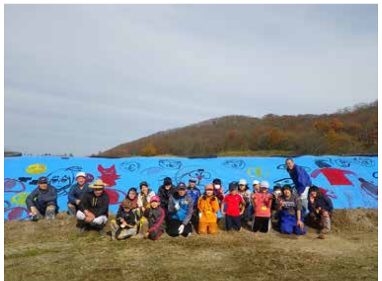
絵が描かれたスタックの前で記念撮影

て頑張っ このあと、タンチョウが飛来する季節を迎え、今回の活動が吉と出るか凶と出るか、それとも全く意味はなかったかは、現段階では分かりません。ただ、タンチョウの農業被害を食い止めようと子どもたちが頑張る様子と、それを見守る大人の姿に、タンチョウとの共生を目指す鶴居村の向かう先が見えた気がしました。